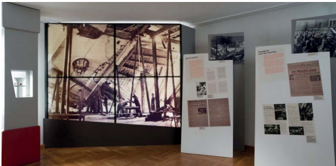
Georg Elser e l'attentato dell'8 Novembre 1939 Il colpo di stato di Hitler del 1923 – la preparazione dell'attentato - l'attentato dell'8 novembre 1939 – le conseguenze dell'esplosione – la propaganda – le reazioni