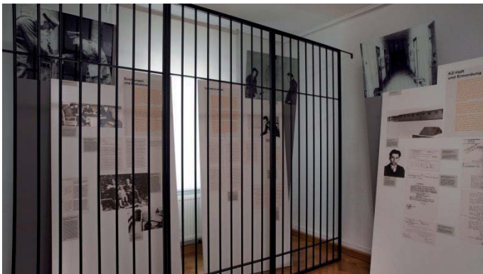
L'interrogatorio, l'arresto e la morte Indagini e arresto – interrogatorio – Detenzione nel campo di concentramento e assassinio dopo il 1945

Già dal 1938 il falegname Georg Elser stava pianificando di uccidere Hitler per evitare l'imminente guerra. Egli venne a conoscenza che l'8 novembre del 1939 Hitler avrebbe tenuto un discorso nella birreria di Monaco "Bürgerbräukeller" in occasione dell'anniversario del suo colpo di stato del 1923. Elser riuscì ad avere accesso alla sala e installò di notte un esplosivo corredato di timer.