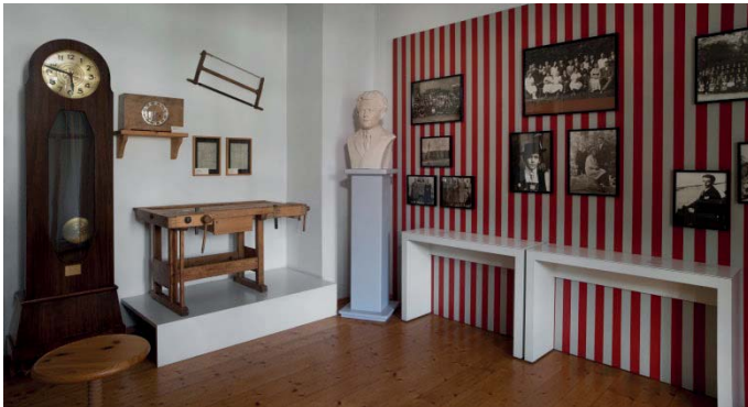
Biografia di Georg Elser – Protocollo dell'interrogatorio – Articoli