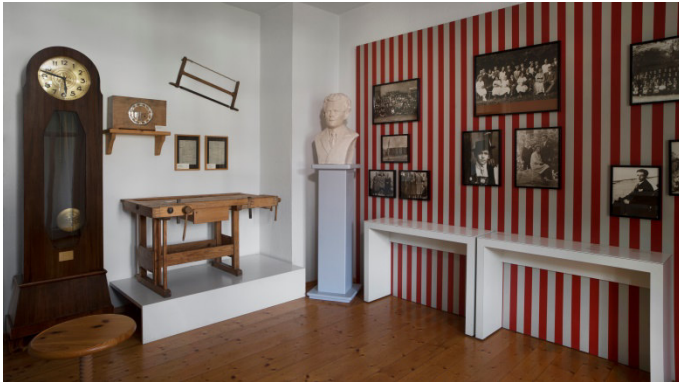
La biographie de Georg Elser : procès verbal de l'interrogatoire – articles de presse