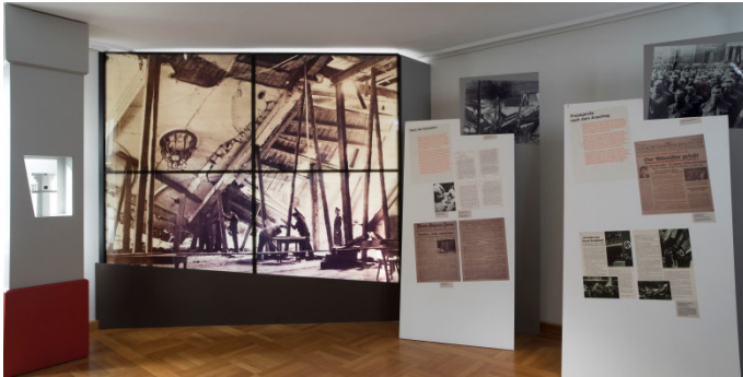
L'attentat du 8 nov. 1939 : le putsch raté de Hitler de 1923 - décision de passer à l'acte – préparatifs - l'attentat - après l'explosion - la propagande nazie - les réactions