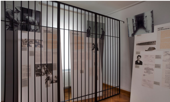
L'interrogatoire, l'emprisonnement et la mort : l'enquête et l'arrêt - l'interrogatoire - camp de concentration et exécution - du prisonnier spécial - après 1945

Dès 1938, le menuisier Georg Elser projette de tuer Hitler et d'empêcher ainsi la guerre qui menace. Il apprend que le 8 novembre 1939, jour d'anniversaire du putsch de Hitler en 1923, le dictateur prendra la parole à la brasserie Bürgerbräukeller de Munich. Elser arrive à entrer et à se cacher le soir dans la salle de réunion et y installe pendant des nuits de labeur un engin explosif avec détonateur à retardement.